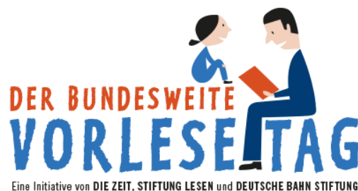
BILD KLANG LESUNG IN DER STADTTEILBIBLIOTHEK FREISENBRUCH ZUM BUNDESWEITEN VORLESETAG 2019!

Über eine halbe Millionen Menschen haben beim letzten Vorlesestag mitgemacht, unglaublich! Seid am 15. November 2019 wieder mit dabei und macht mit bei der größten Vorlese-Bewegung in Deutschland!